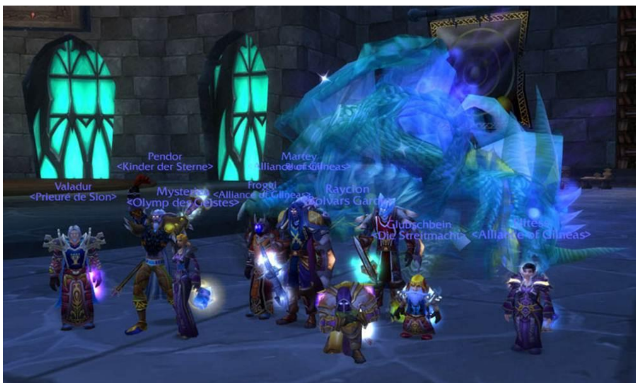
Abbildung1: Kampfgruppe in World of Warcraft vor einem erlegten Drachen

Die für die Entstehung von Abhängigkeit entscheidenden Spielformen sind die späteren Gruppenkämpfe gegen diverse Monster, bei denen fünf, zehn oder fünfundzwanzig Spieler gemeinsam agieren. Diese kennen sich meist nicht persönlich, sondern sitzen in verschiedenen Orten allein vor ihren Rechnern und erzeugen mit Maus und Tastatur virtuelles Kampfgetümmel. Sie können miteinander chatten oder über Headsets kommunizieren.